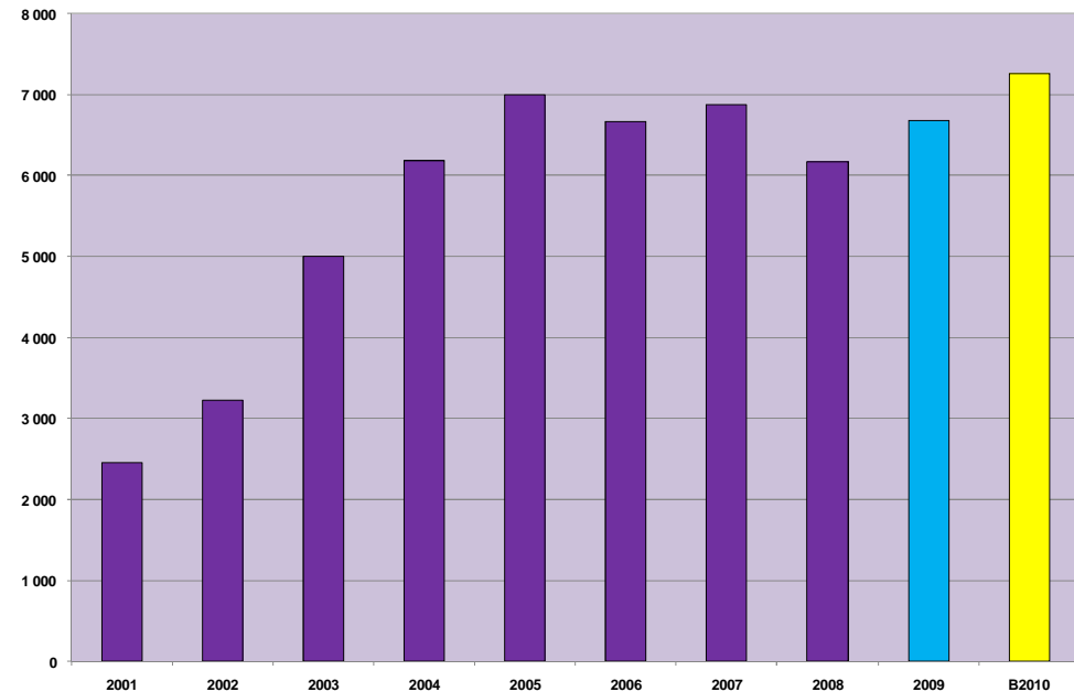
Liikevaihdon kehitys 2001 - 2010